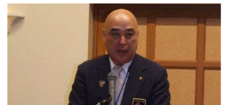
松倉ガバナー挨拶