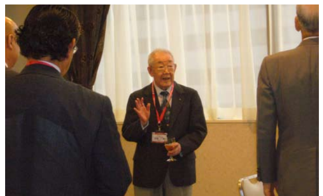
吉野パストガバナー乾杯挨拶