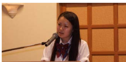
各高 I A クラブ現況報告