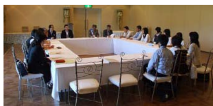
グループ討論の様子