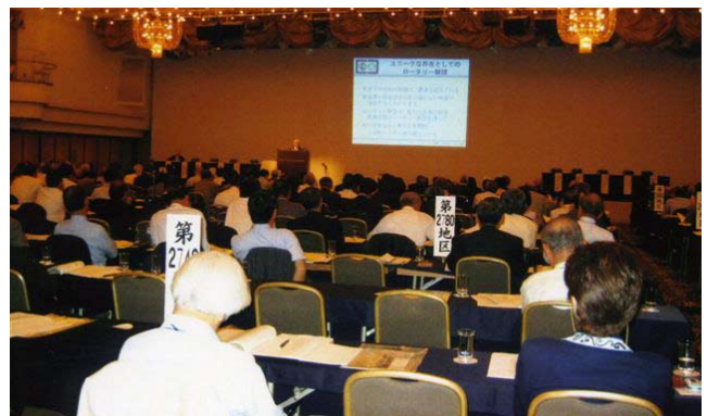
セミナー会場の様子