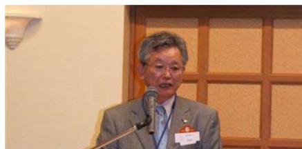
田崎桐生西 R C 会長挨拶