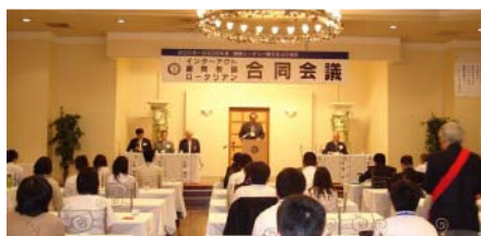
下井田委員長挨拶