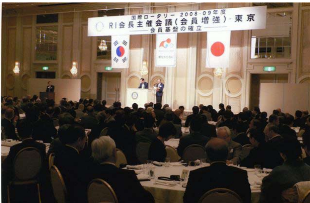
RI会長主催会議の様子