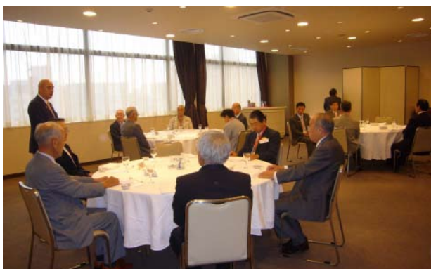
松倉ガバナー懇親会挨拶