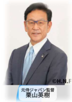
元侍ジャパン監督 栗山英樹