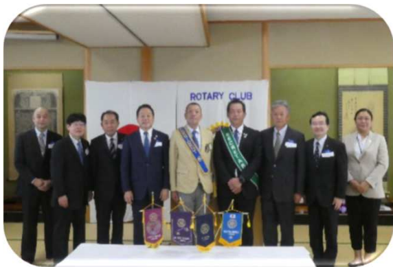
須永ガバナー補佐と桐生4RC会長幹事の皆様