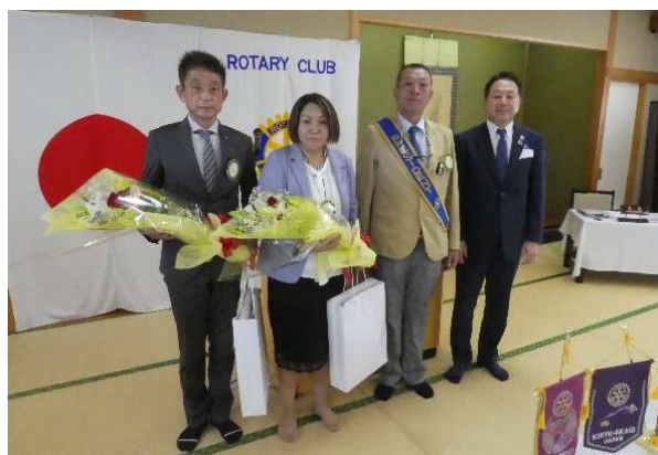
須永ガバナー補佐からバッチ授与して頂きました