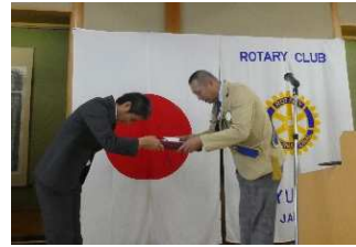
池末直前幹事へ記念品贈呈