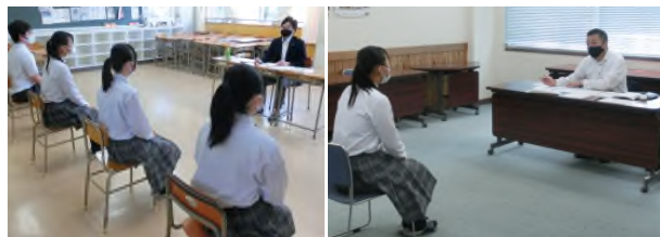
一日目の集団面接