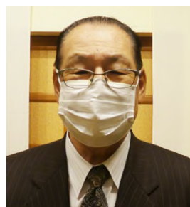
家住 慧路君 (住宅建設)