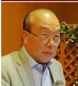
クラブ研修リーダー パスト会長