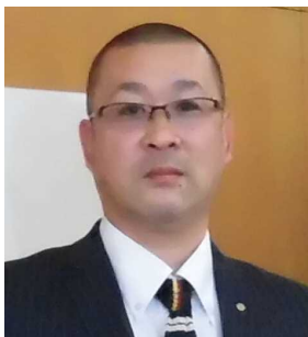
奉仕プロジェクト委員長