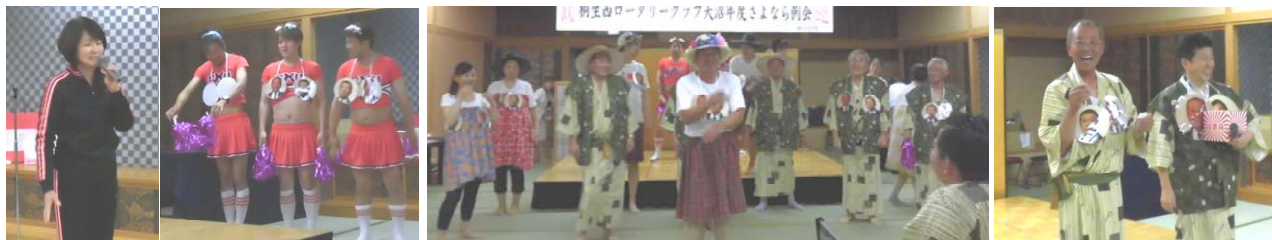
みゆき先生登場！メタボ約1.5名のキャンディーズ？みゆき一座のエンディングは入り乱れてのフラダンス、男子チャンがチモロスキ 最後は抽選会、天沼会長ご満悦