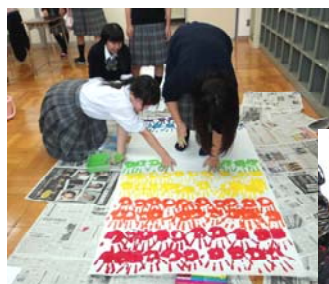
10月には文化祭がありました。部員全員で手形をとって手形アートを作りました。