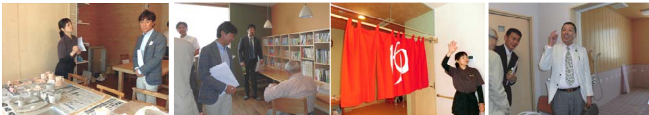
リハビリ療法や陶芸、読書も楽しめる充実した設備に加えカフェも併設。まるで温泉に行った様で老後の心配が解消され気分も明るくなります。