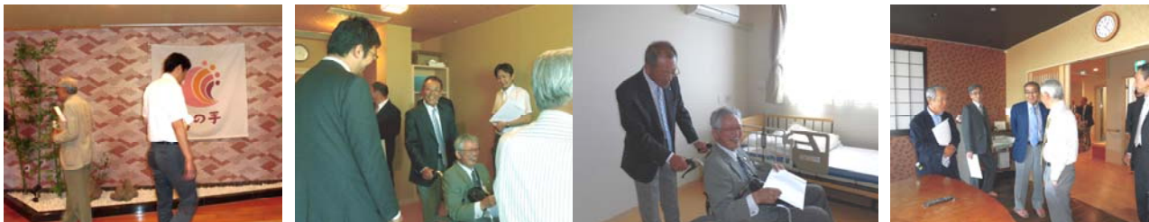
玄関を入ると温泉旅館のロビーの様です。ショートステイや高齢者住宅の各個室は壁紙が全て異なるという思いやりが。ご家族と過ごせるキッチン付居間も充実。