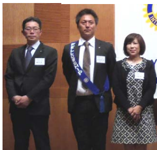
桐生赤城新会員の皆様