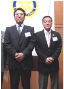
桐生赤城次年度会長幹事