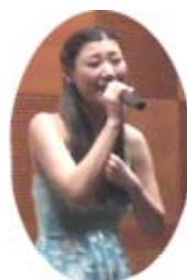
乾杯の前にMのメンバー

この様な席でお時間を頂きまして、赤城RCの皆様ありがとうございます。また桐生西RCの皆様には、1年半に及びお世話になりました。前橋からの出席でしたので、やる気は充分あったのですが休会することが多く、また転勤により退会する事になり申し訳ありません。私はロータリーの精神が大好きで、自分の仕事を通じてお役に立てる事はないかという思いで日々務めておりました。今後もその精神で取り組んで行きたいと思っております。群馬が好きでしたので残念ですが、社名の為やむを得ません。今まで本当にありがとうございました。