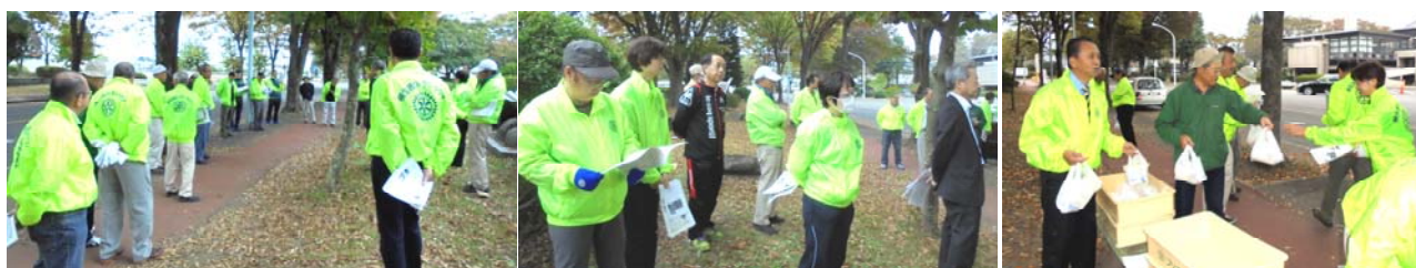
ポール・ハリス記念植樹の月桂樹1世から今日の4世までの軌跡に耳を傾ける会員諸氏 朝食が配られて解散です