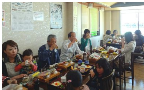
大人には新鮮なお刺身などの海鮮料理が お子様にはエビフライやイクラご飯などのお子様ランチでした