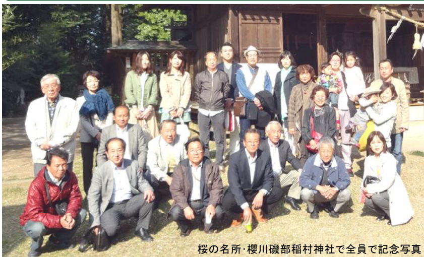
桜の名所・櫻川磯部稲村神社で全員で記念写真

阿左美年度の家族会行事『春の茨城を楽しむバス旅行』が、春爛漫の4月13日(日)に開催されました。