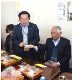
那珂湊おさかな市場の食堂で略式の点鐘を行いました