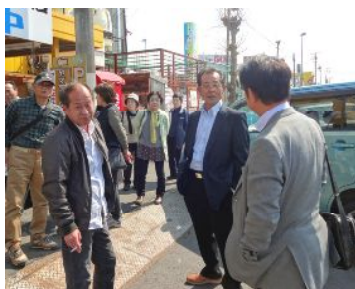
食後の一服。乾さんお疲れですか？