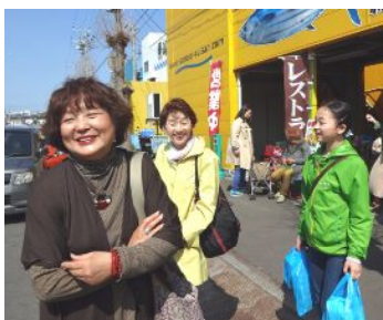
おさかな市場で皆さん大量のお買い物。バスのトランクも一杯になりました。