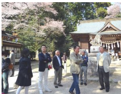
桜川のサク見物。境内では『桜川』を歌う歌手のライブや特産品販売のイベントがありました。因みに右奥の黄緑のジャンパー3名は西RCではありません