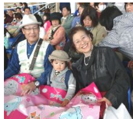
可愛いお孫ちゃんとイルカショーを楽しみました