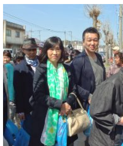
保冷梱包に並ぶ幹事ご夫妻