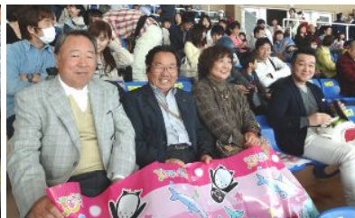
年甲斐もなくとは言いませんが水しぶぎがかかる前列に陣取りました