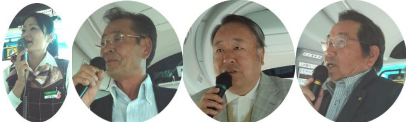
ベテランの美しいガイドさんでした 昨夜のお酒が残って 挨拶は高速道路に乗ってから 細やかな気遣いをされる 阿左美会長挨拶 出発間もないバスの車中 中野夫人から美味しい物がたくさん回ってきました

水族館で童心に帰り大自然の大海原と春の景色を満喫した一日でした。念入りな下見を経て計画し、実施して下さいましたクラブ運営さんに感謝です！