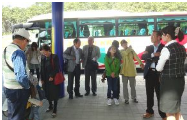
10時前に水族館に到着 バスから降り立ったところです