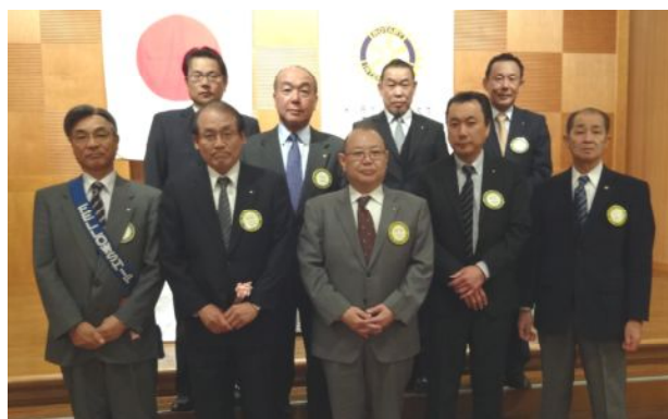
向田会長エレクトを中心に選出された次年度理事役員の皆様