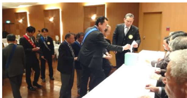
投票風景、開票は別室にて行われました。