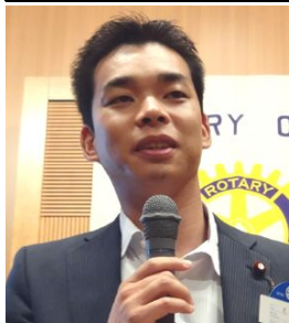
衆議院議員 井野俊郎様