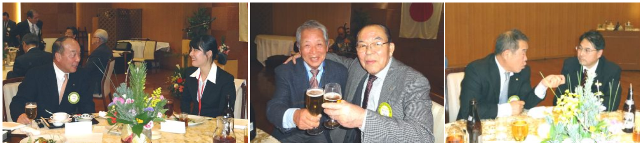
初春の宴でのツッシュットの数々。今年も友情の輪を深めて広めて、ロータリー活動に邁進しましょう！