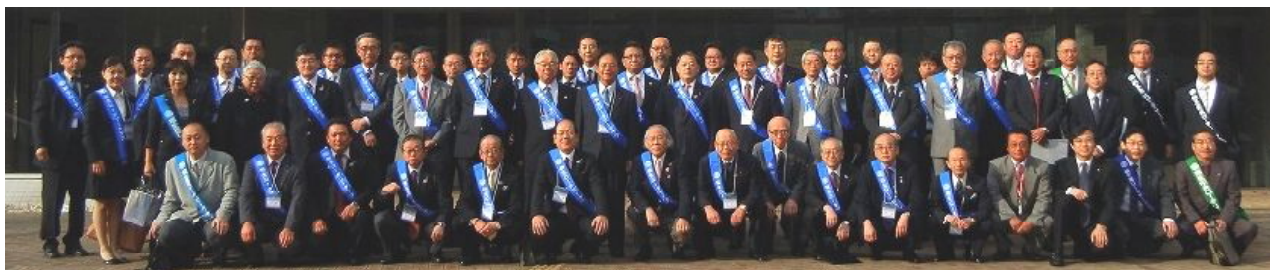
朝8時に集合して、桐生RCの地区大会実行委員会と4RCのお手伝い全員で疋田ガバナーを中心に記念写真を撮りました

感謝状 米山功勞クラブ 4000万円達成クラブ 貴クラブは予てより米山奨学事業のために多額の寄付をせられその功績大なるものがあります。依て本奨学会はそのご理解とご協力に対し感謝状を贈り深甚なる敬意を表します