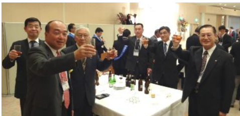
スカイホールでの懇親会。当クラブ有志で乾杯