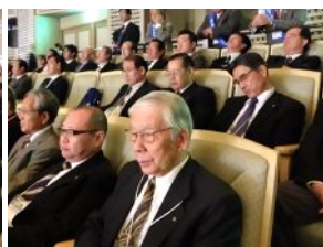
参加クラブ紹介では元気良く手を振って