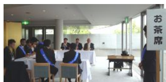
シルクホール内ロビーには数々のブースが設けられました