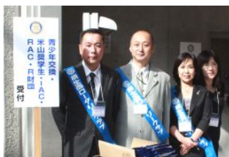
コホストクラブとして受付お手伝い