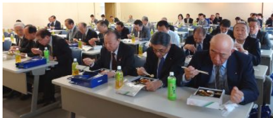
桐生市市民文化会館4F第1会議室での昼食風景