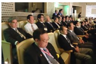
開会直後の当クラブ会員席。1F最後尾でした。