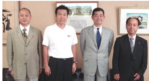
石原奈みどり市長と 記念写真