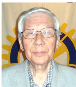
クラブ会報・雑誌担当

8月10日(金) 東郷年度納涼家族会 点鐘 PM6:30、 会場 桐生プリオパレス (家族会総会 PM6:00~)