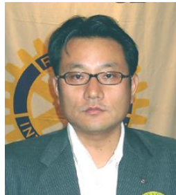
新世代奉仕当 インターアクト担当