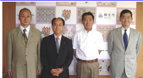
亀山豊文桐生市長と 記念写真