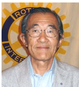
ロータリー財団・米山・ニコニコBox (抛金) 委員長