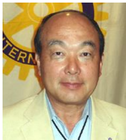
国際奉仕・友情交換担当

今年度は、高津戸荘の慰問の他、ぐんま昆虫の森へ植 樹協力、早朝清掃奉仕、地域内からの協力要請に対して 柔軟に対応していく、これらの事を行いたいと思 一年間、ご協力を宜しくお願い致します。