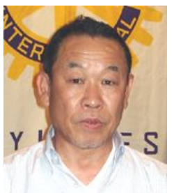
新世代奉仕・ ローターアクト担当

今のところ、以上3点が担当行事となっております。 一生懸命やっておりますので、皆様のご協力とご指導 をお願い申し上げます。