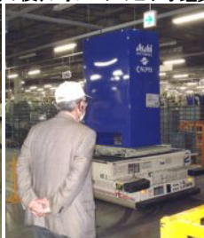
音声ガイド機器とキャップを付けて2代のマイクロバスに分乗してフォレスト見学。その後、広い工場見学。毎年国内外から10,000人以上の見学者が訪れます。