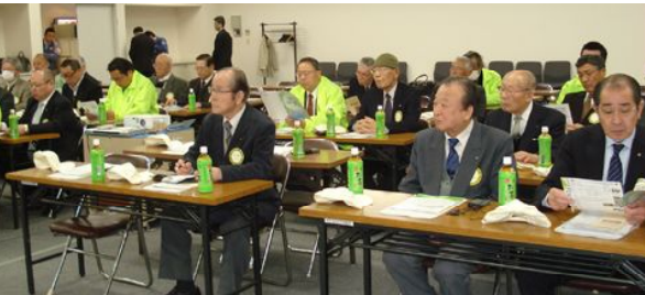
職場訪問進行役・乾職業奉仕担当 サンデンフォレストの概要説明に熱心に耳を傾ける会員