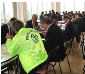
豊富なメニューからお好みを選択。