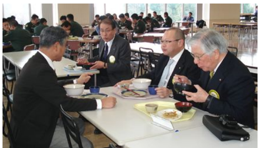
1200名以上の社員さん対象の広い食堂にて昼食。