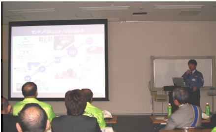
パワーポイントでの説明の後、フォレストのビデオ鑑賞