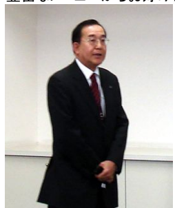
本社からお越し下さった古沢関東支社長様