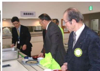
食後は電子マネーで自動精算。