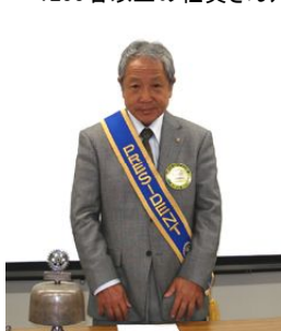
江原会長の点鐘・挨拶