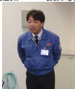
概要説明の貝塚総務部長様