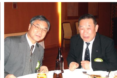
とても仲睦まじそうな雰囲気でした?