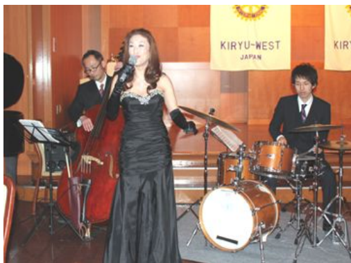
大人の雰囲気の素敵なジャズグループでした