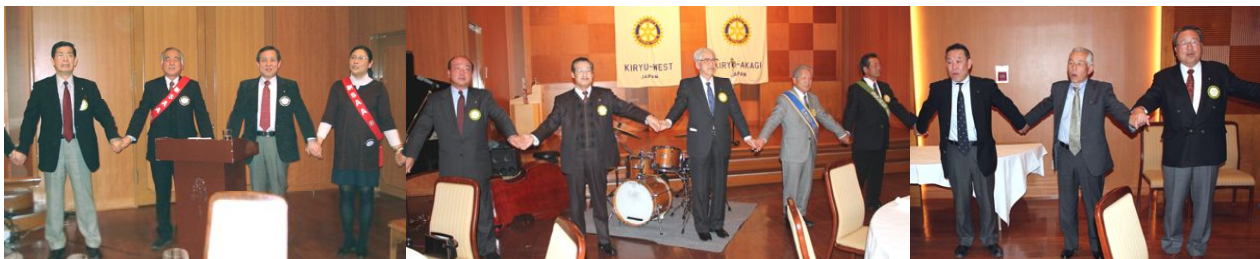
最後は全員で仲良く『手にて手つないで』