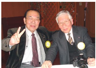
地区協議会の正副実行委員長さんです