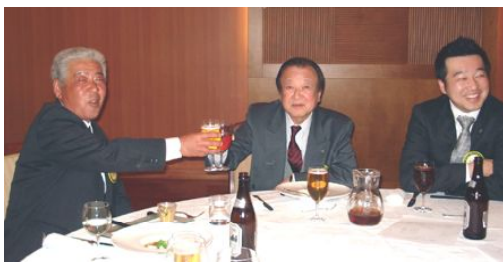
桐生西クラブの中堅、ベテラン、若手のお三人です