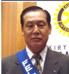
家住慧路君 (住宅建設)