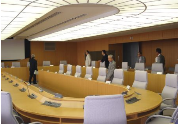
5Fオピニオンホール 国際会議場を想定して2カ国語通訳ブースも兼備