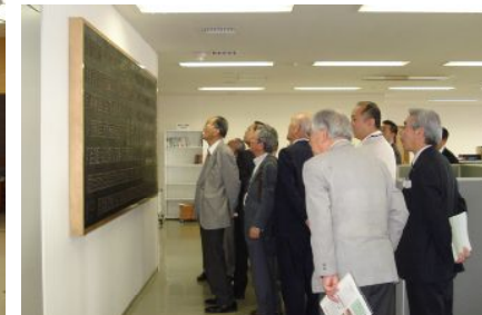
5F会頭室 会頭のデスクと応接セット。月1回正副会頭会が行われます。奥には特別応接室が設置。 2F事務所 会館建設寄付金ボードを眺める会員