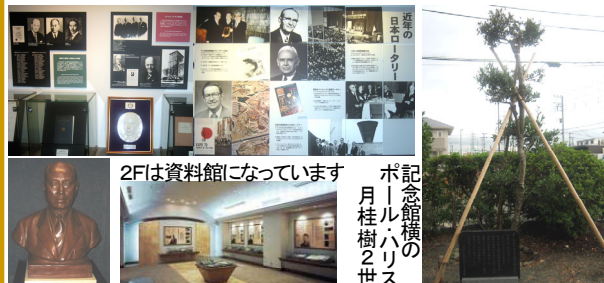
2Fは資料館になっています 記念館横のポールハリスの月桂樹2世