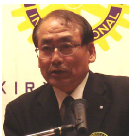
奉仕プロジェクト委員長