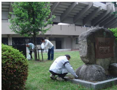
我がクラブの歴史を重んじ手入れする会員