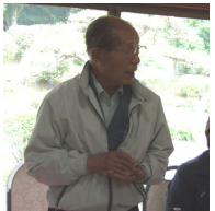
井本P会長の乾杯のご発声