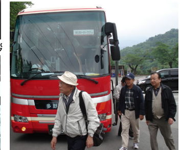
足取りも軽くまだまだ余裕です