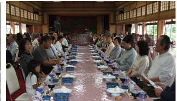
有隣倶楽部で豪華な昼食