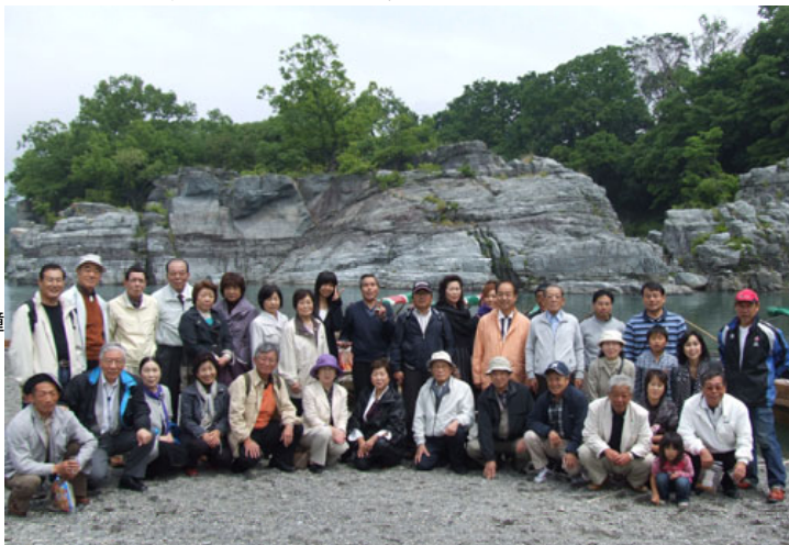
参加者全員でライン下り終点の岩畳で記念写真