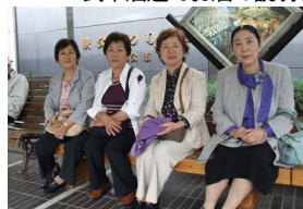
旧藪塚の美女軍団です