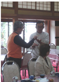
会長幹事で仲良く点鐘