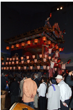
秩父まつり会館で実物大の屋台見学