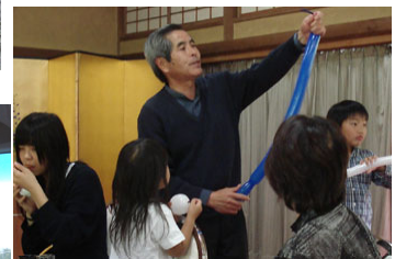
Mr. ガーリックのマジックも楽しめて