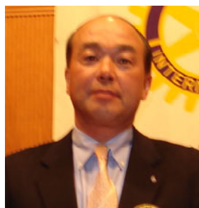
奉仕プロジェクト委員長