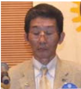
地区ローターアクト委員長