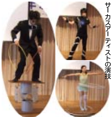
サーカスアーティストの演技