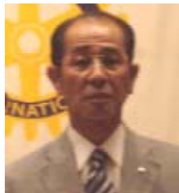
インターアクト委員長