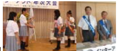
次期主催の高崎健大付属高校へA旗授与 当方 員もお手伝い