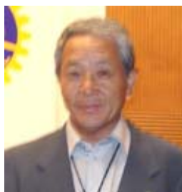
副会長・管理運営委員長