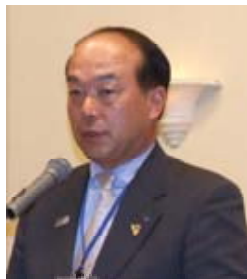
会長ノミニー・奉仕プロジェクト委員長

管理運営委員会と致しましては、出席委員会、プログラム委員会、親睦委員会、ニコニコBOX委員会、健康管理委員会の5委員会各位と連携して活動を行います。皆様のご指導、ご助言を宜しくお願い申し上げます。