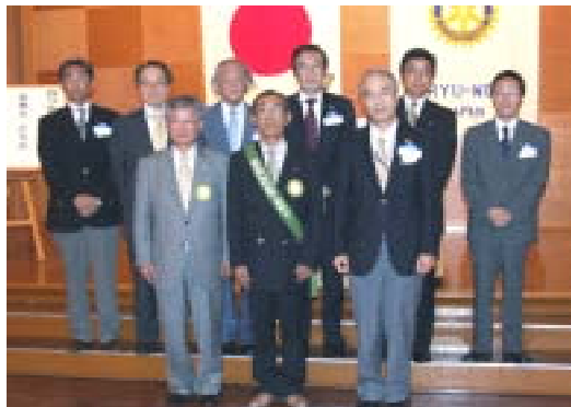
2008-09年度桐生5RCの会長幹事の皆様