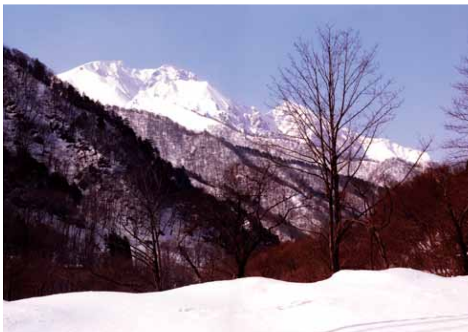
湯桧曽公園付近より谷川岳双耳峰を望む