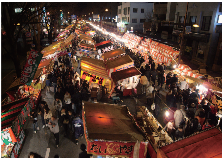
前橋初市まつり