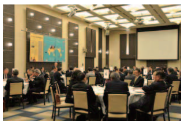
1日目合同セミナーの様子