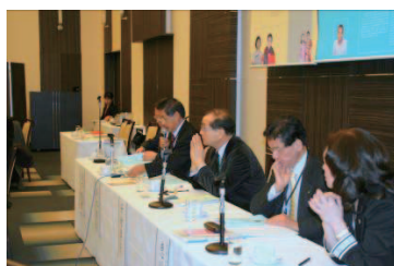
フォーラム講演者の方々