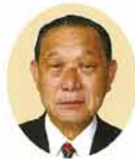
R I 第 2840 地区 ガバナー 安藤震太郎